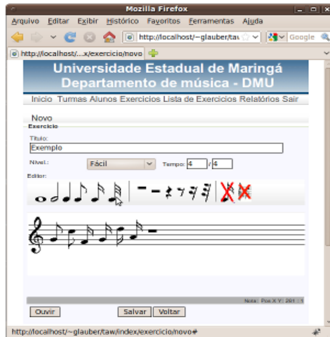
Figura 7. Editor de exercícios

Optou-se por utilizar uma imagem GIF para cada nota ao invés de figuras básicas como bandeirolas e hastes para facilitar a inserção e remoção de notas e pausas. Essas operações funcionam de forma similar: primeiro é feita a alteração no metamodelo e depois é desenhado a partitura correspondente. Uma regra importante da notação musical é o fato de que, caso a nota ultrapasse os limites do pentagrama, linhas auxiliares deverão ser desenhadas. No sistema TAW, optou-se por utilizar imagens das figuras rítmicas com essas linhas quando necessárias.