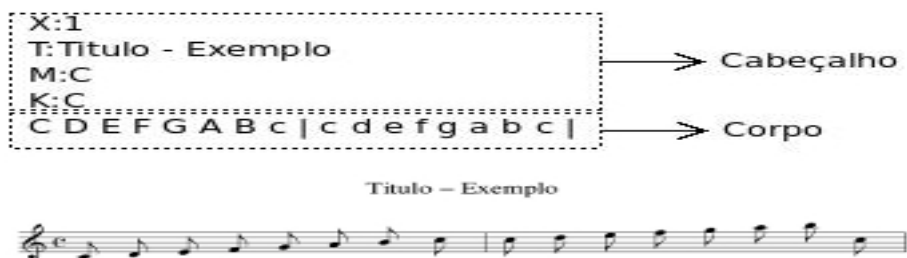
Figura 4. Arquivo básico ABC e resultado gerado com o programa abcm2ps

De uma forma simplificada, pode-se considerar um metamodelo como uma representação de outra já existente. Para representar a partitura musical, de acordo com Phillips [5], tem-se como exemplo a notação ABC, a notação midiXML e a notação do software Lilypond.